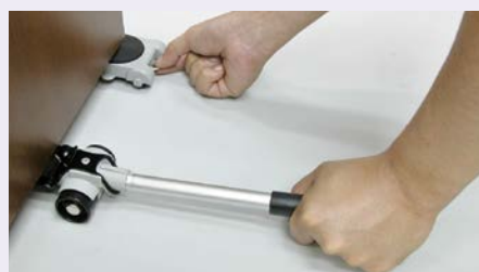
リフターで持ち上げて、台車を4隅に入れます。